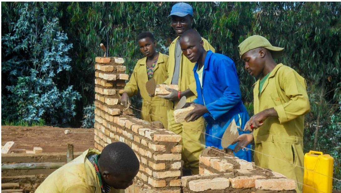
De bouwvakkers van het Centrum zijn volop in de weer met het metselen van de muren.