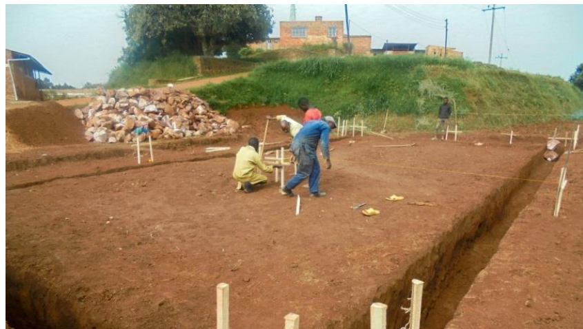
De fundamenteën voor het gebouw zijn uitgegraven. De contouren van het gebouw worden duidelijk zichtbaar.