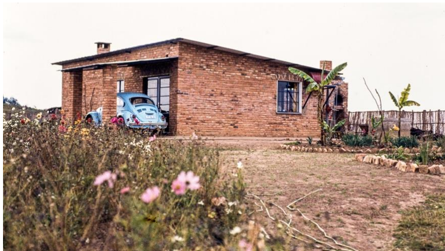
Zicht op de woning waar het gezin Zwiers drie jaren woonde.