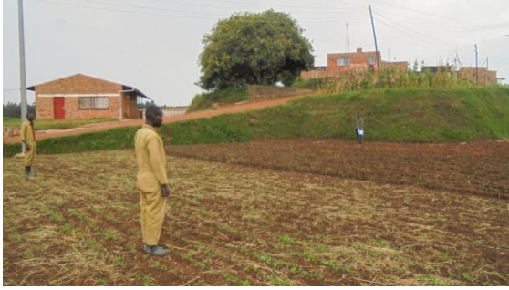
Op een vrijgemaakt terras worden de hoekpunten van het 'CPA-North-South Lodge and Meeting Center' uitgezet.