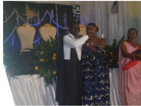
bruid en bruidegom

Het jonge koppel ge elkaar de erewijn vooraleer het podium te betreden.