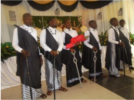
de bruidegom en getuigen

Meteen komen de twee woordvoerders, die door de families aangesteld zijn, in actie. De voorstelling kan beginnen. Nu is het een theater maar dan zonder acteurs: de acteurs zijn de trouwers en hun vrienden en familie. En ze voeren het op alsof voor hen de tijd is blijven stilstaan. Ze menen het ook zo echt: plechtig, met volle ernst. De spanning is op hun gezicht af te lezen. Vanaf nu gaan we plots een eeuw terug in de tijd.