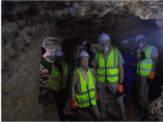
in de mijngangen

Na het bezoek aan de mijn is het tijd om onze bezoekers naar de luchthaven te voeren.