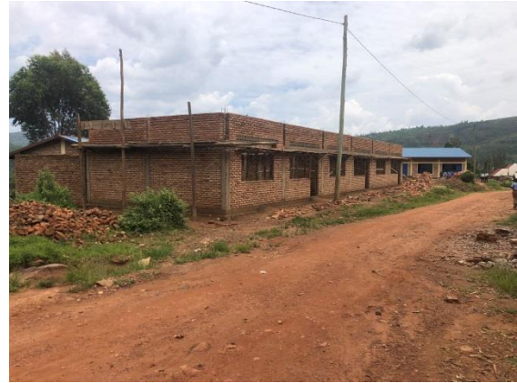
School Muzanza 1A

Ook aan de school in Muzanza. Blok 1 A met drie klassen zal klaar zijn in maart.