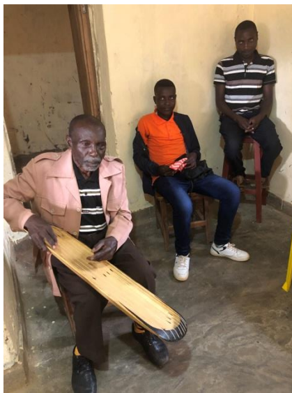
muzikant en zijn snaarinstrument

We krijgen later nog een fantastisch optreden van een muzikant die een zelfgemaakt snaarinstrument bespeelt.