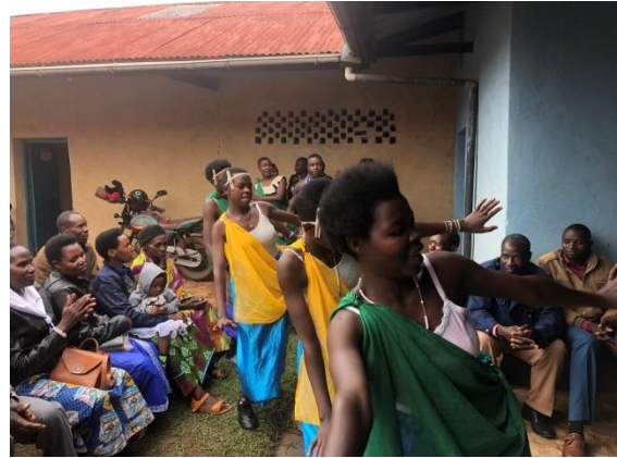
Feest na de hoogmis