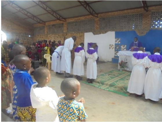
hoogmis in Mutandi

We krijgen later nog een fantastisch optreden van een muzikant die een zelfgemaakt snaarinstrument bespeelt.