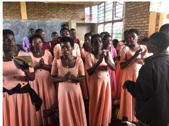
Koor van Buyoga

Na de hoogmis in Rubona ben ik uitgenodigd op een meeting van de verschillende zangkoren van de omgeving Kisaro. Het moet gezegd dat de koren ongelooflijk geëvolueerd zijn in de loop van de voorbije tien jaar: uitgebreid repertorium, meerstemmige gezangen, de muzikale begeleiding en de kledij.