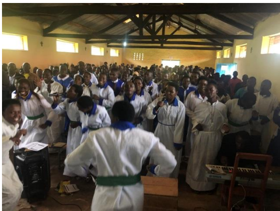
kerkje van Rutabo

Volgende week ga ik naar de hoogmis in een ander gehucht Rubona, een andere keer is het de beurt aan Rusasa en tegen het einde van mijn verblijf ben ik wel overal eens op bezoek geweest. Telkens wordt het een beetje feestelijk afgerond met een sobere maaltijd.