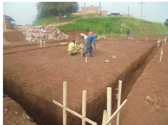
Funderings sleuven van de bezoekerswoning

Mijn energie begint weer op te borrelen en dan het is van: "kom we gaan een slagske doorzetten want dat moet hier klaar zijn in juni als de studenten en begeleiders van het Sint-Jozefcollege uit Bokrijk aankomen. "