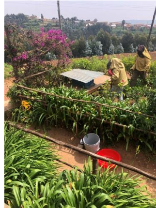
bijennest overgeplaatst in de kast