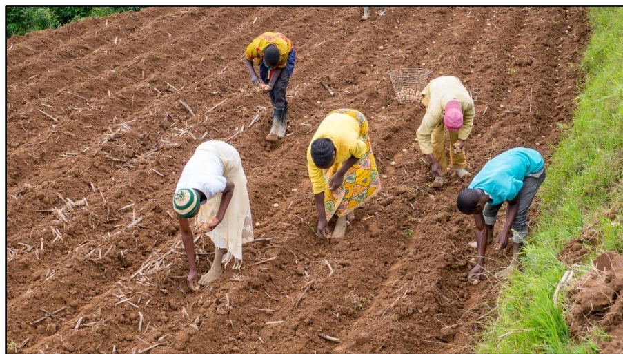
▲ Men legt het aardappelpootgoed in de groeven.