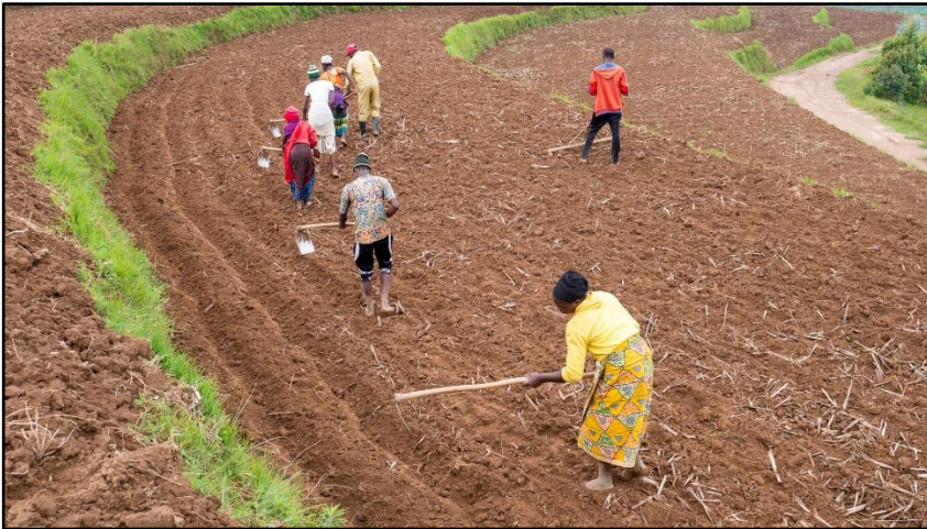
▲ Voor het planten van de aardappelen worden groeven (voren) van 10 cm diep gemaakt.