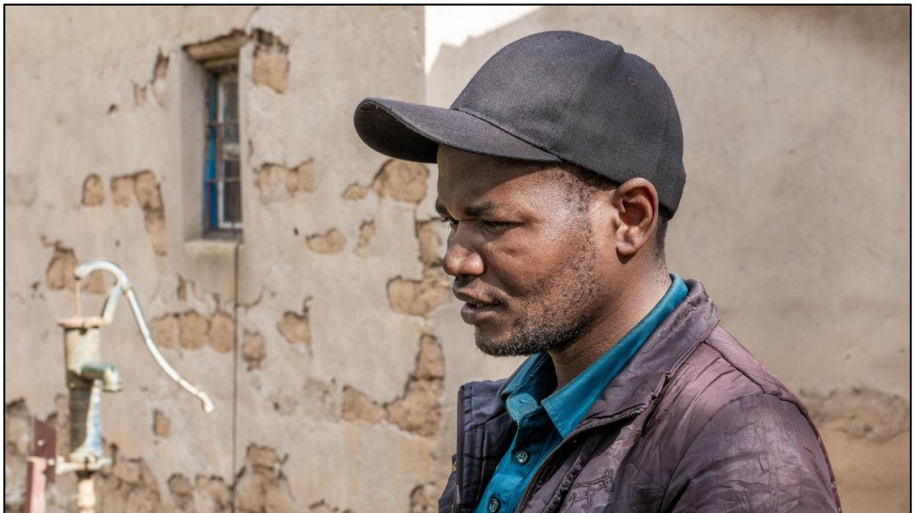
▲ Tuli is een gedreven man, iemand die elke nieuwe dag met vastberadenheid en moed beleeft.