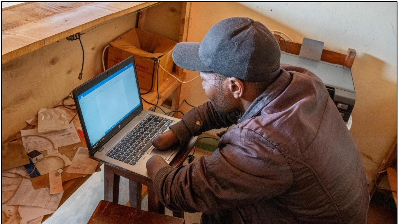
▲ Tuli weet zich goed te behelpen met de laptop, maakt kopieën en ondersteunt dorpsgenoten bij officiële documenten.