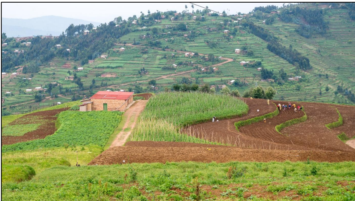
▲ Vanaf het planten tot het oogsten moet men rekenen op ca. 90 dagen.